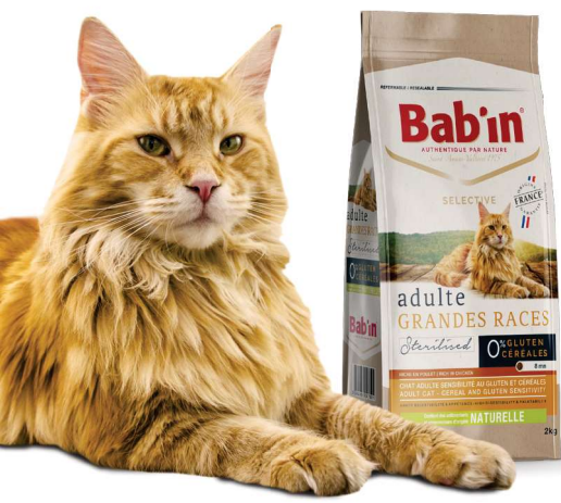
Disponible en 2 & 8 kg